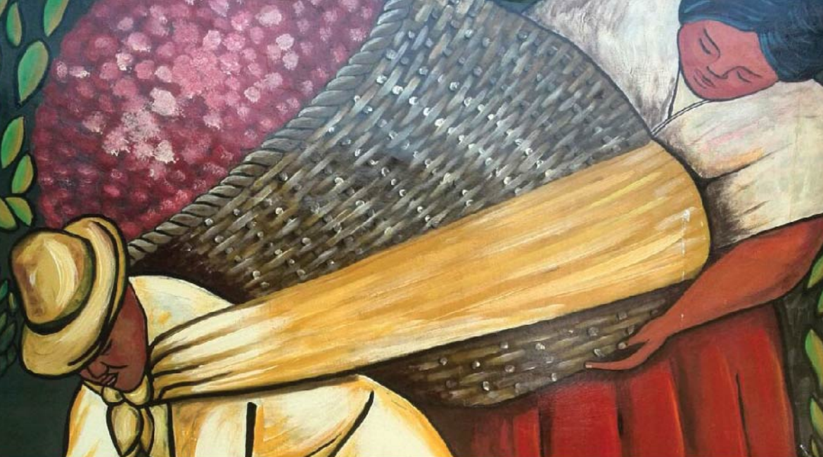
El Cargador de Flores (detalle). Obra del artista mexicano Diego Rivera, interpretada por el Colectivo Muralista Armando Reverón . Barquisimeto, 2015.