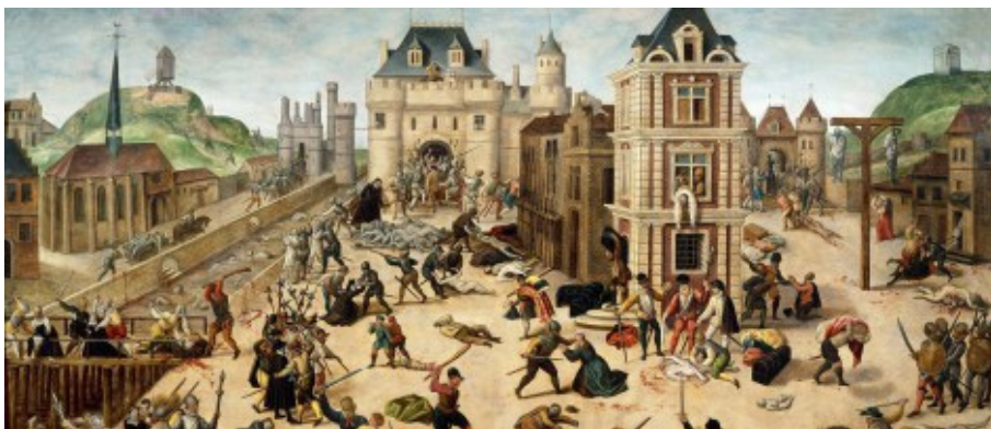
Pintura de Portada: François Dubois, La matanza de San Bartolomé (1576-1584), Musée Cantonal de Beaux-Arts, Lausanne.